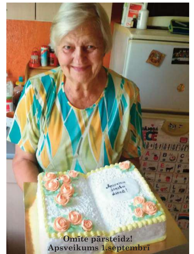
Omīte pārsteidz! Apsveikums 1.septembrī