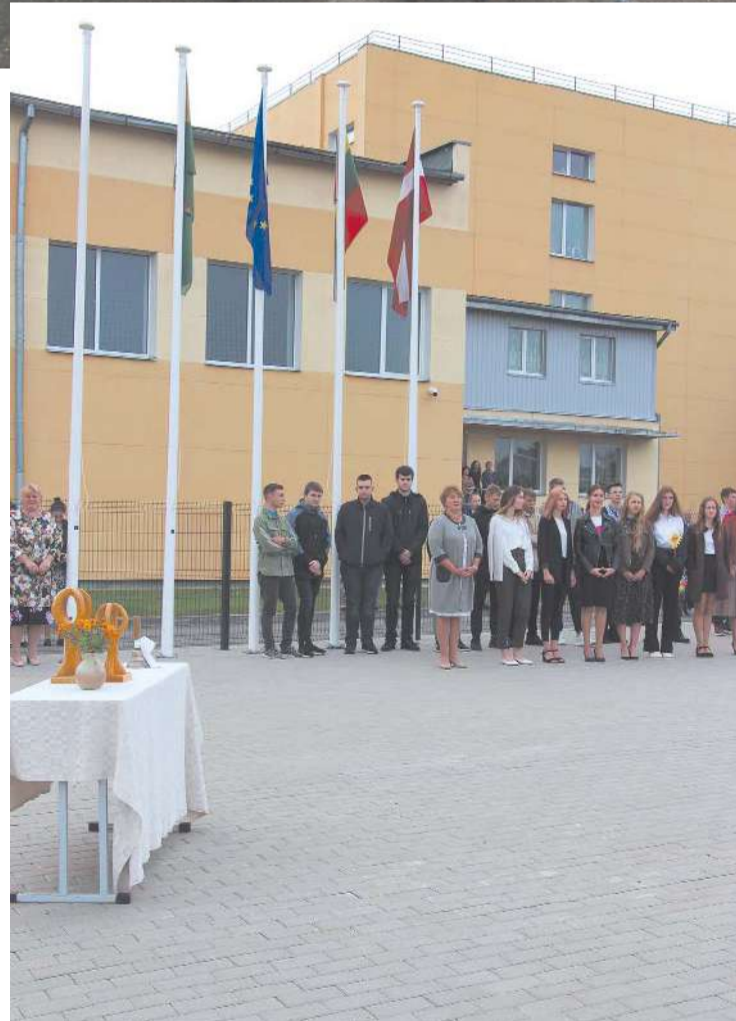
1. septembris Dagdas novada skolās