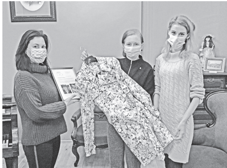
Šaņemtais dāvinājums - SIA „NEMO” ražotais mētelis, kuru izvēlējusies Dānijas karaliene Margrēte.

pums ir ilūzija. Pašiem, protams, vajadzētu bāzēties uz Latvijā ražoto, lai mazāk būtu jāeksportē, tas ir primāri. Tomēr, ja papildus iekšējam patēriņam spējam pārdot savu produkciju citās valstīs un šo iegūto naudu atgrieziet Latvijā, tā jau ir liela vērtība. Tieši par šo eksportēto vērtību ceļas