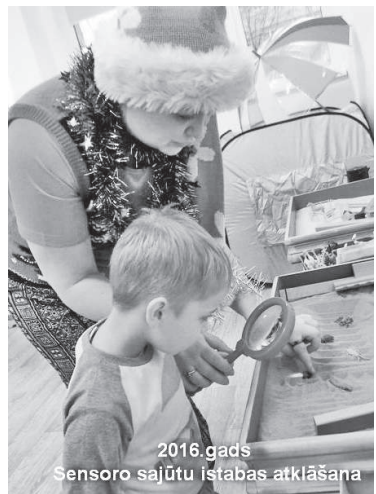
2016. gads Sensoro sajūtu istabas atklāšana

Pašlaik es bieži vien ar lepnumu vēroju, ka mani bijušie „Pīlādzīša”