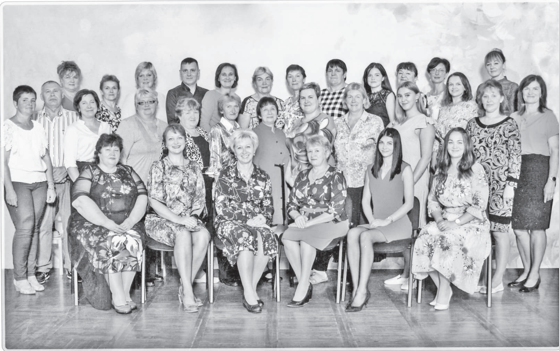
Krāslavas p.i.i. „Pīlādzītis”

Jeļena Vorošilova Foto no personīgā un iestādes arhīva