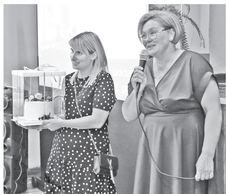
pirmajiem saules stariem.

Mēs ceram, ka Kalniešu skolas absolventu salidojums kļūs par labu tradīciju.