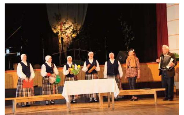
Aulejas sieviešu vokālais ansamblis “Aulejas sievas”