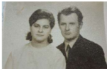
Vectēvs ar vecmammu (1970)