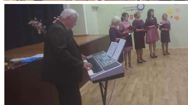
Konstantinovas sieviešu vokālais ansamblis “Vēja zvans”