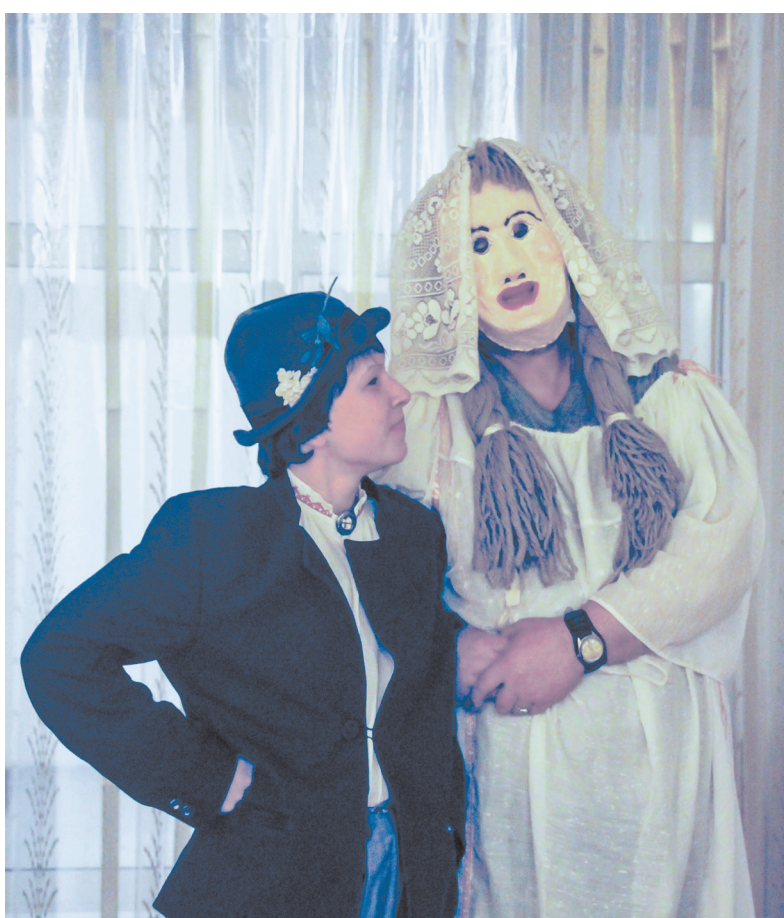
Folkloras kopas „Olūteņi” šovs