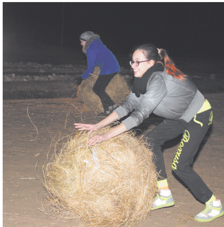
Komandu stafete „Sniega bumbas velšana”