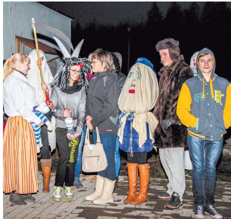
Ķekatnieki pašdarinātās maskās

7. martā daudzi pulcējās Vides un izglītības centrā