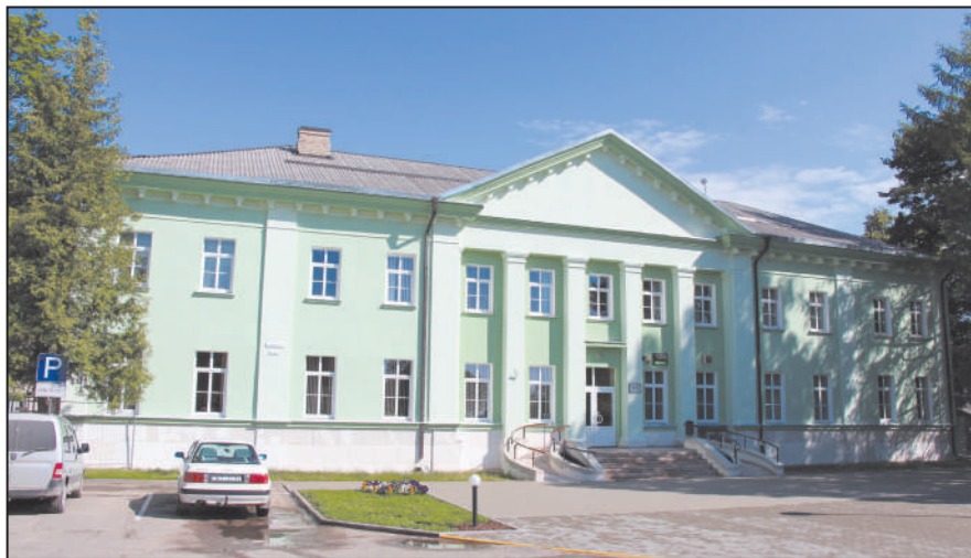
Dagdas novada domes jaunais izskats