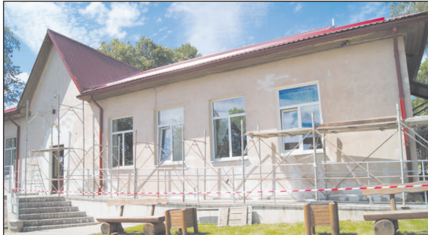
Dagdas novada JIC fasādes remonts

No jaunā mācību gada ēdināšanu skolā nodrošinās pašvaldība, jo beidzās līgums ar uzņēmumu, kas iepriekš nodrošināja pakalpojumu. Lai nodrošinātu ēdināšanas pakalpojumu, tiks pieņemti pieci darbinieki. Samaksa par