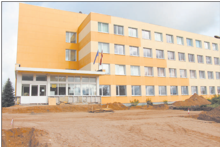
Dagdas vidusskolas lieveņa kāpņu renovācija

belēm, kā arī nomainīti logi, taču ārējās fasādes remontam piesaistīt līdzekļus līdz šim nebija iespējams.