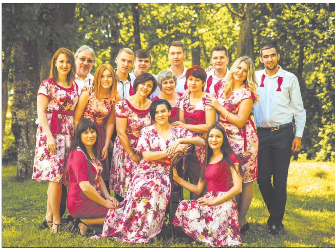
Tagadējais vokālās grupas "Solversija" sastāvs