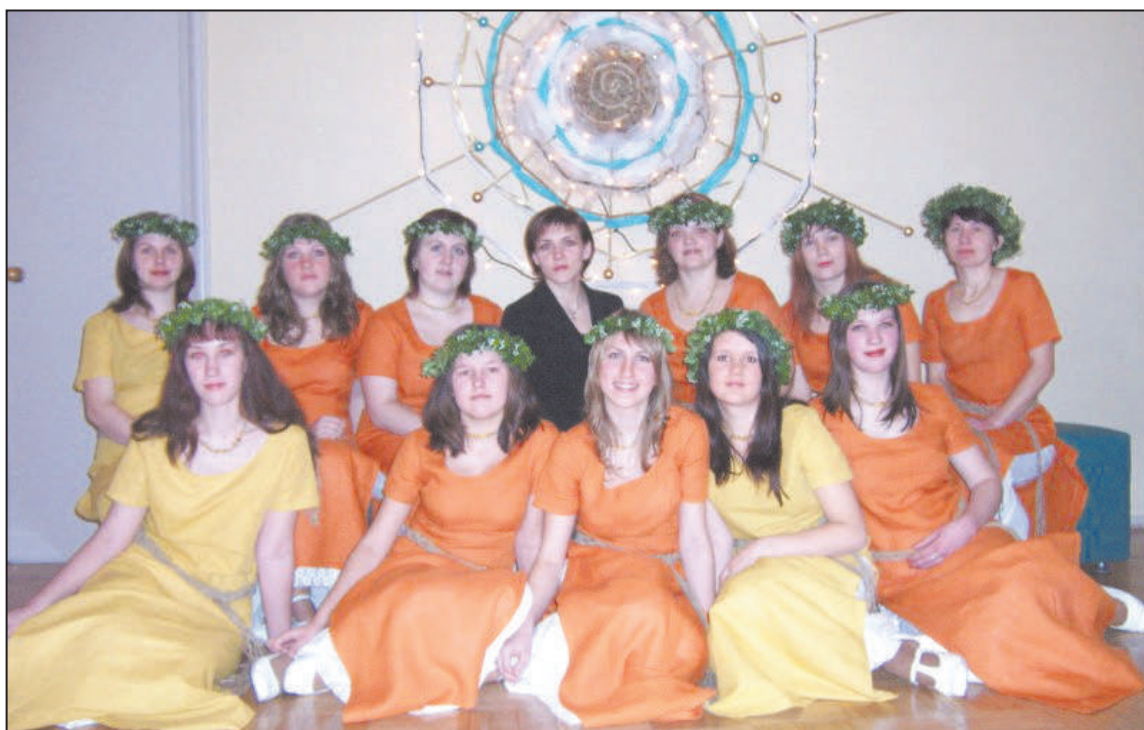
„Oremus” Starptautiskajā garīgās mūzikas festivālā "Sudraba zvani" Daugavpilī