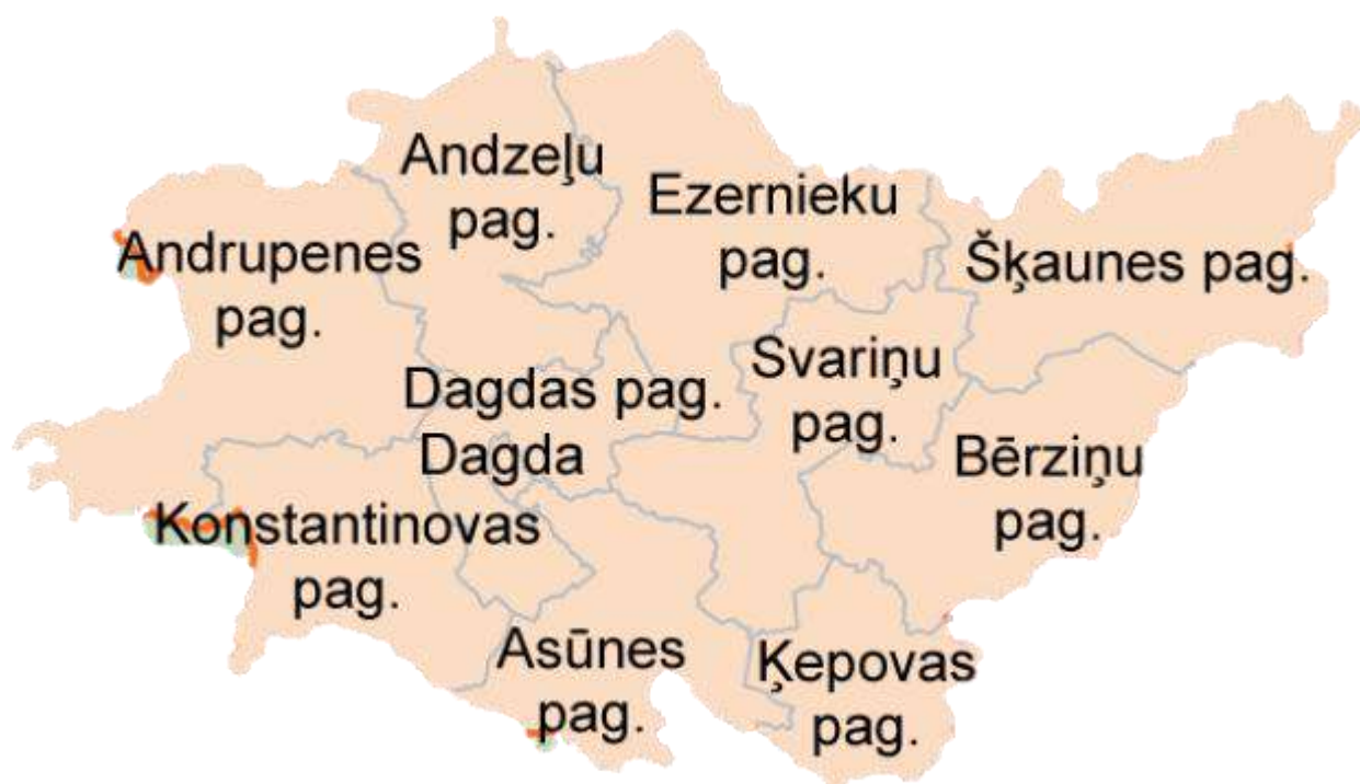
Dagdas novada karte