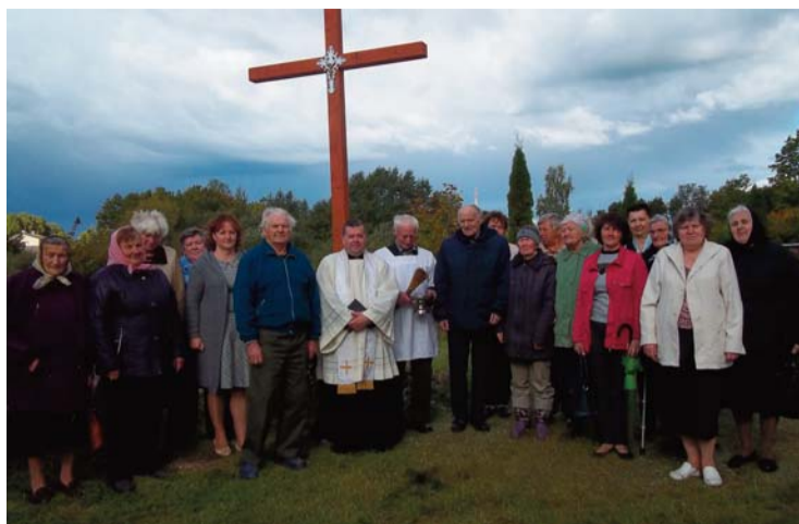
krucifiksi, jo joprojām dzīva ir gandrīz 200 gadus sena katoļu tradīcija „Maija dzie-

Baznīcas dārzos un ceļa malās Latgalē tiek uzstādīti