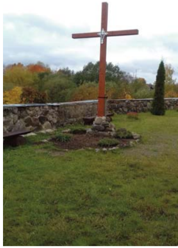
Asūnes draudzes iniciatīvas grupa, pateicoties Dagdas novada pašvaldības projekta "Sabiedrība

ar dvēseli 2019" finansiālam atbalstam, realizēja projektu "Krucifiksa atjaunošana un teritorijas labiekārtošana Asūnes baznīcas dārzā".