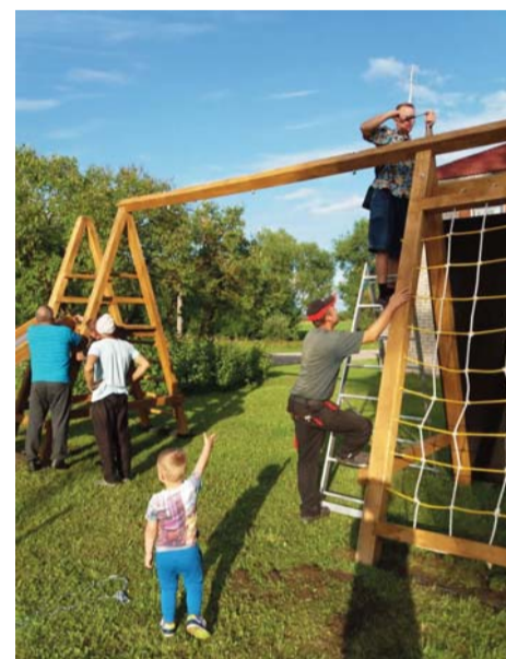
sniegto atbalstu projekta realizēšanas laikā.

Ciemata iedzīvotāju vārdā gribam pateikties Dagdas novada pašvaldībai, Attīstības un plānošanas nodaļas projektu koordinātoriem, par