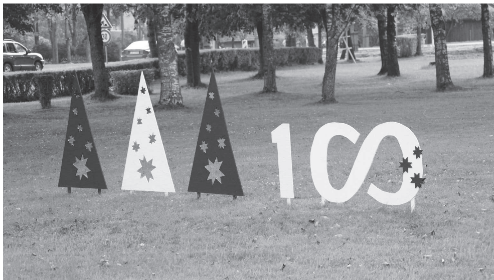
VSPC "Dagda" Latvijas 100 - gades simbols