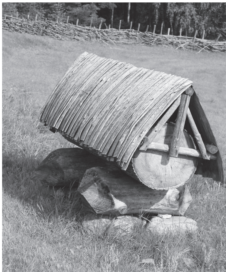
Bišu strops, kas taisīts ievērojot senču tradīcijas un tehniku.

Ar stāstiem par bitēm, medu, biteniekiem un viņu palīgiem Dagdas novadā aizvadīts trešais Latgales stāstnieku festivāls „Omotu stuosti par bitinīkim”, kas šogad tika veltīts bitenieka amata izziņāšanai. Festivāls no šī gada 20.–21. jūlijam norisinājās Dagdā, Andrupenē, Zundos un Jaundomes muižā, pulcējot stāstniekus no dažādiem Latvijas novadiem un Spānijas, kā arī vietējās folkloras, māksliniekus un pašus amata pratējus – biteniekus.