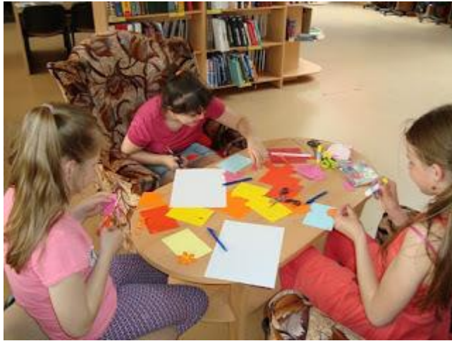
„Pārsteidz savu māmiņu” (2016. gada 6. maijā)