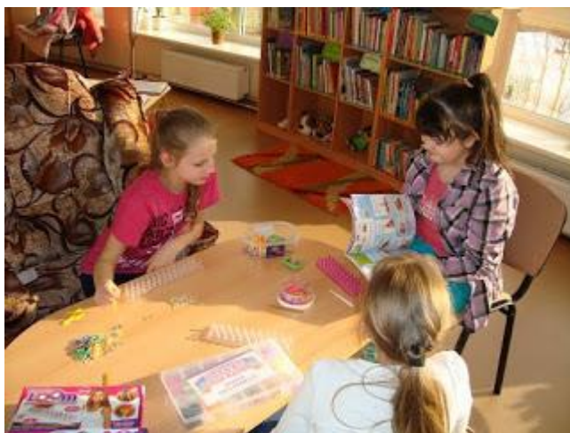
„Meiteņu rotas” (2016. gada 4. martā)