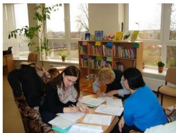
Bibliotēka piedalās programmā „Klientu apkalpošanas operators” (2016. g. 23.martā -6. maijā)