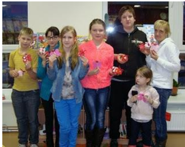
„Valentīndienu gaidot...” (2016. gada 12. februārī)