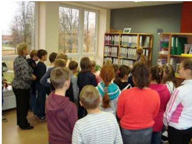
Karjeras nedēļas ietvaros Dagdas vidusskolas 5. klases skolēni iepazīnās ar bibliotēku un tās iespējām (2016. gada 12. oktobrī)