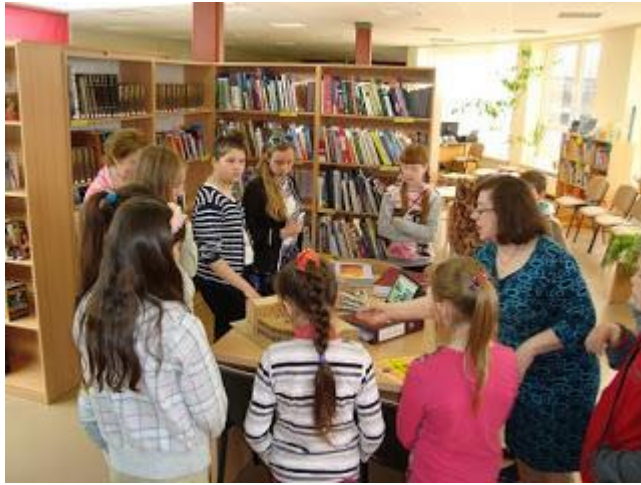
Ar Kastuļinas pagasta „Bērnu un jauniešu žūrijas” dalībniekiem (2016. gada 28. aprīlī)