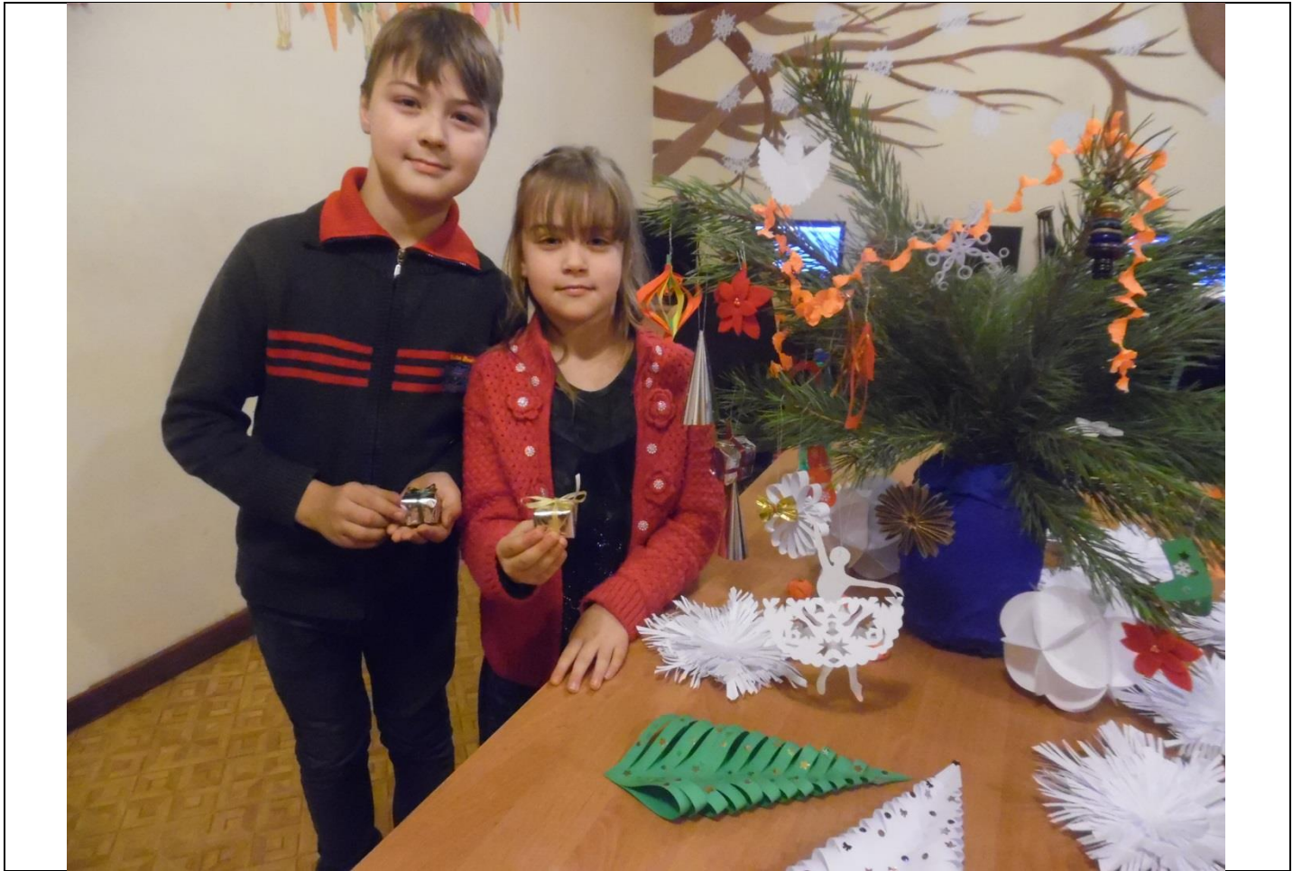
Tika izveidota izstāde „Ak, eglīte, ak eglīte” -19.gs. 20-80.gadu eglīšu rotājumi un rotaļlietas.