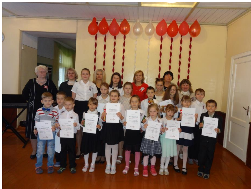
Asūnes sākumskolas kolektīvs Latvijas simtgades svētku priekšvakarā

Pasākuma beigās visi draudzīgi dziedāja dziesmu “Nekur nav tik labi kā mājās”. Lai plaukst un zeļ mūsu Latvija! Atcerēsimies – sveicot Latviju dzimšanas dienā, mēs sveicam arī paši sevi, jo valsts taču esam mēs paši – katrs atsevišķi un visi kopā! Arī mūsu sarežģītajā un mainīgajā laikā Latvijas un brīvības ir tik daudz, cik tās ir mūsu sirdīs un prātos.