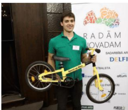
SpeedUpBike, IK Lienes dārzi, tūrisma pakalpojumi novadā (Mazsalacas novada komanda, Vidzemes augstskola)