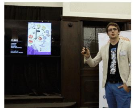
RISEBA A-WAKE (Ludzas novada komanda, RISEBA)