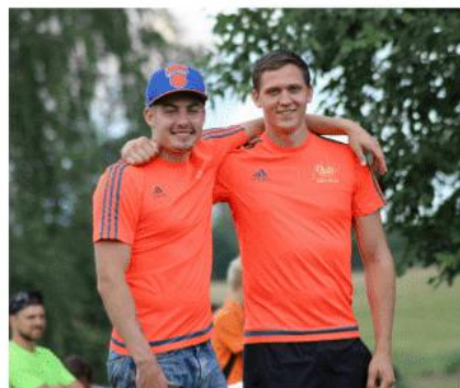
Baltic disc golf (Gulbenes novada komanda, Ventspils augstskola)