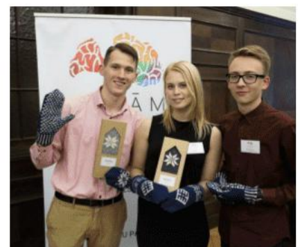
PAARIS (Pļaviņu novada komanda, Rīgas Ekonomikas augstskola)