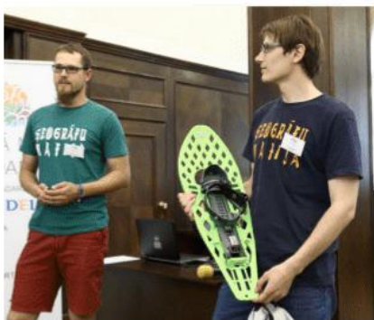
Purvabrīdeji.lv (Madonas novada komanda, Latvijas Universitāte)