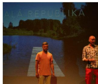
Zaļā Republika (Siguldas novada komanda, Latvijas Universitāte)