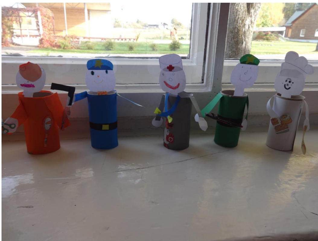
Pirmsskolēnu nākotnes profesijas

Ikviens no skolēniem jau skolas gados sapņo par savu nākotnes profesiju. Skolā no 8.10 -12.10. notika "Karjeras nedēļa". Visu nedēļu skolēniem tika organizētas dažādas aktivitātes: plakātu, zīmējumu, kolāžu veidošana, eseju sacerēšana par dažādām tēmām- "Es varu un būšu", "Mana sapņu profesija", "Manu vecāku profesija"