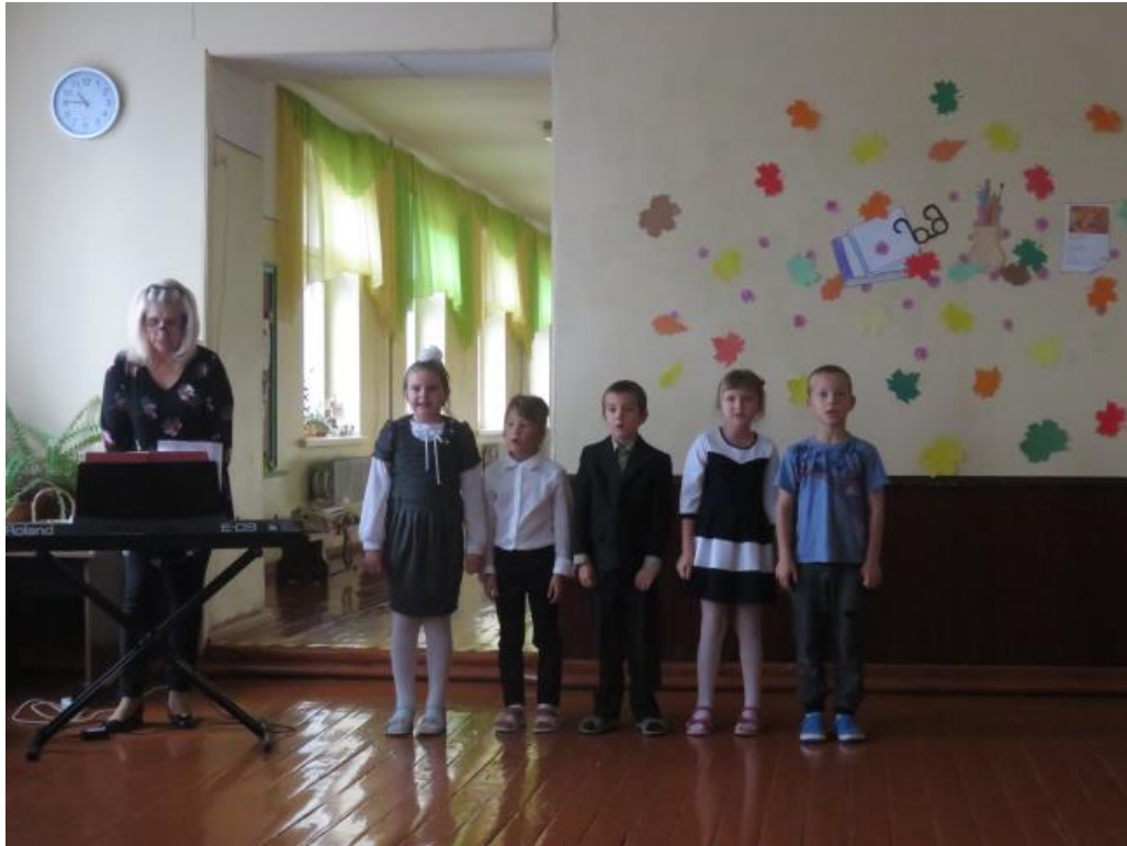
Skolotājus sveica skolas vokālais ansamblis