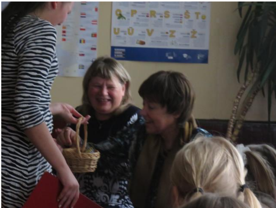
Visi skolotāji tika eksaminēti un saņēma balvas.