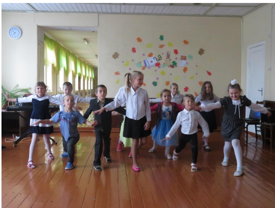
Skolotājus sveica deju kolektīvs "Dejo līdzī"