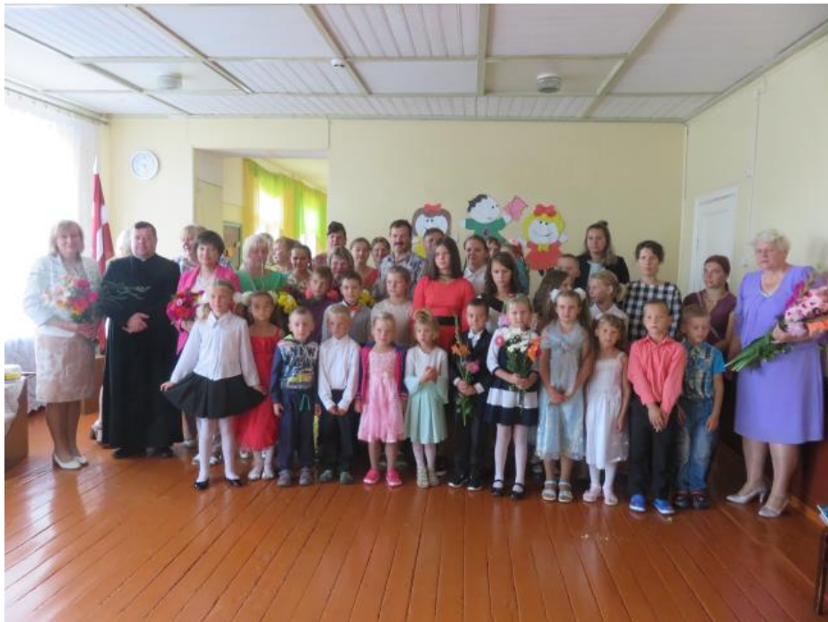
Asūnes sākumskolas kolektīvs 2018.gada 1.septembrī