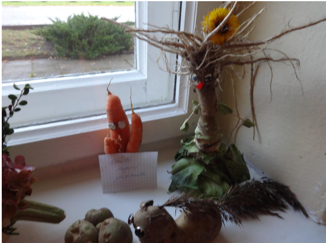
Pirmskolas skolēni darināja tautas jostu izmantojot latviešu raksta zīmes.